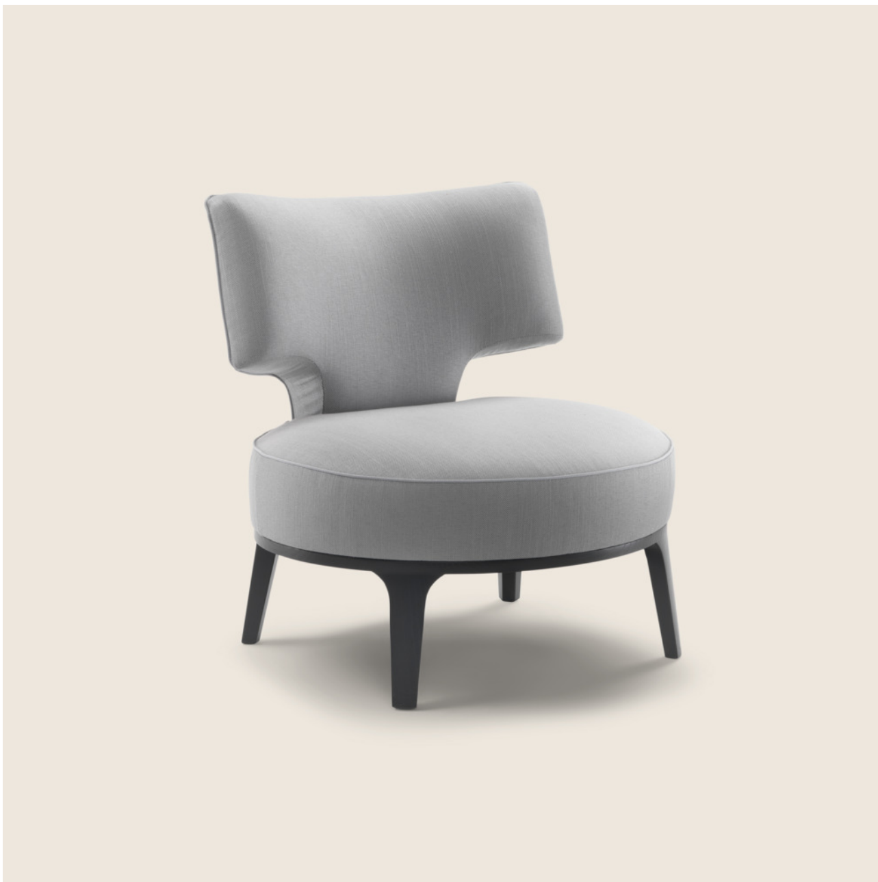
DROP ROBERTO LAZZERONI 2009 POLTRONE