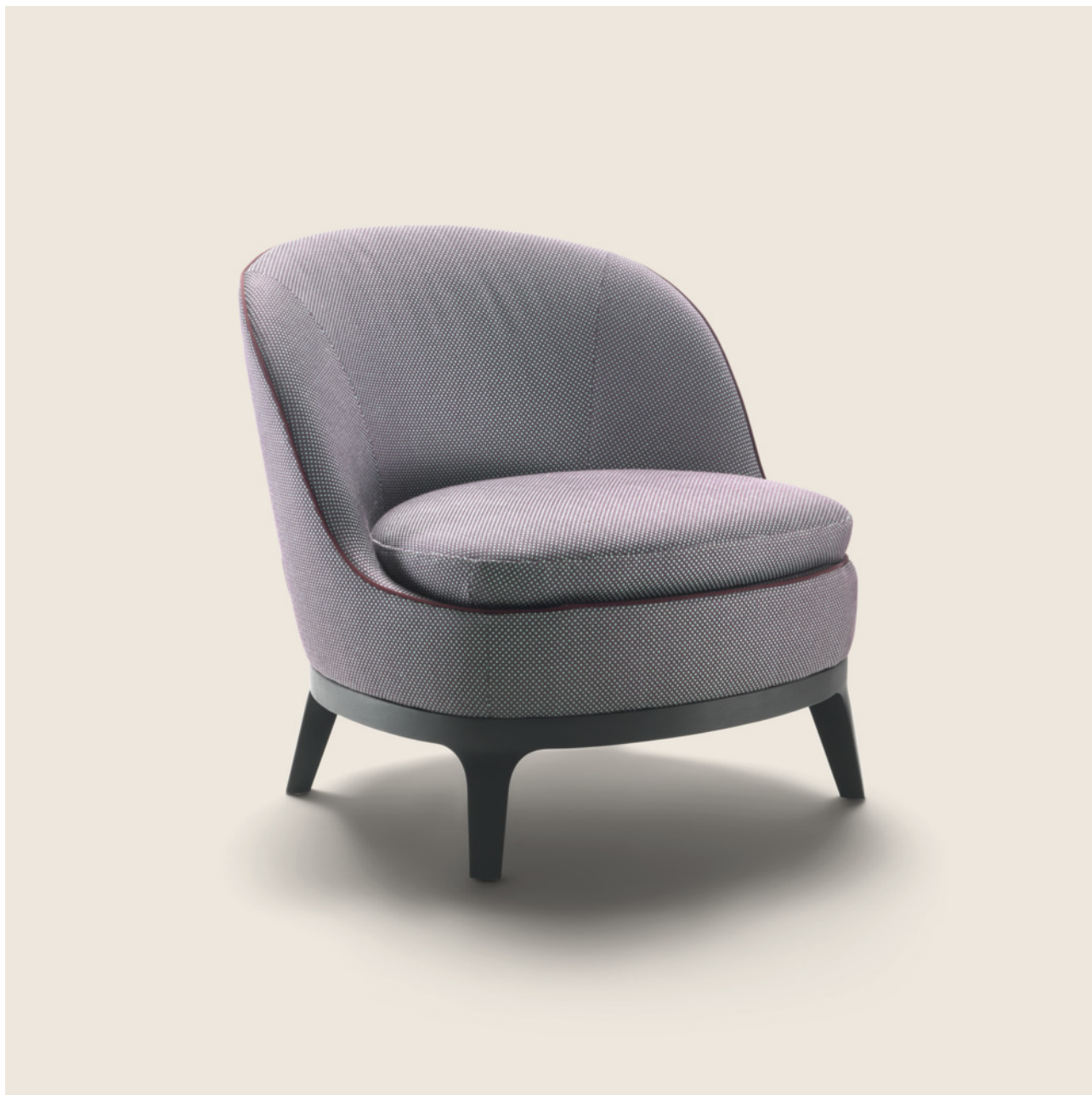
DRAGONFLY ROBERTO LAZZERONI 2017 POLTRONE